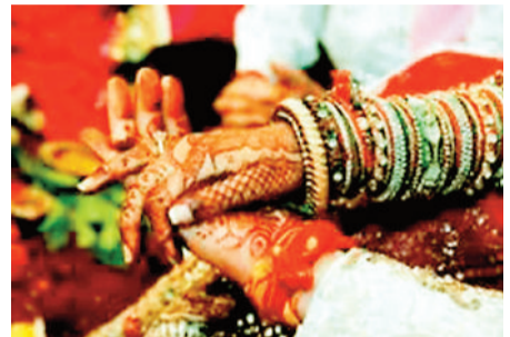
हरिभूमि न्यूज || बिलासपुर

19 अप्रैल को अक्षय तृतीया होने से अबुज्ज मुहूर्त भी शुभ कार्यों के लिए मिलेगा इस दिन कोई भी आग बिना पंचांग देखें विवाह आदि जैसे सभी मांगलिक कार्य कर सकते हैं। पंडित ने बताया कि जब सूर्य देव गुरु बृहस्पति की राशि (मीन) में प्रवेश करते हैं, तो वे अपनी शक्ति खो देते हैं, जिसे 'खरमास' कहा जाता है। इस दौरान किए गए शुभ कार्यों का पूर्ण फल प्राप्त नहीं होता। अब सूर्य मेष राशि में प्रवेश कर रहे हैं और गुरु का बल भी बढ़ गया है जिससे विवाह के बाद वैवाहिक जीवन