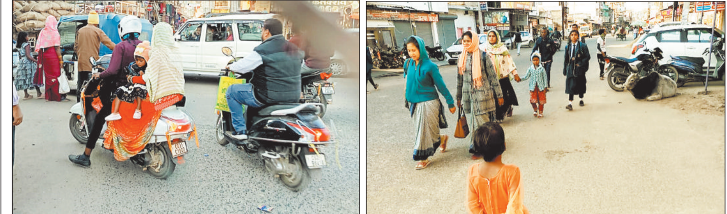
हरिभूमि न्यूज पेंड़ा

जिले के मुख्य क्षेत्र में स्थित पेंड़ा नगर में प्रस्तावित बायपास मार्ग का निर्माण कार्य वर्षों से लंबित होने के कारण आम नागरिकों को गंभीर समस्याओं का सामना करना पड़ रहा है। लगातार बढ़ते यातायात दबाव के चलते नगर के मुख्य मार्गों पर आए दिन जाम की स्थिति निर्मित हो रही है, जिससे जनजीवन प्रभावित हो रहा है। पेंड़ा नगर भौगोलिक दृष्टि से जिले का प्रमुख केंद्र है, जहां से चारों दिशाओं की ओर वाहनों का आवागमन होता है। ऐसे में बायपास का निर्माण अत्यंत आवश्यक माना जा रहा है, लेकिन विगत 8 से 9 वर्षों से यह परियोजना शासन-प्रशासन और जनप्रतिनिधियों की उपेक्षा का शिकार बनी हुई है।